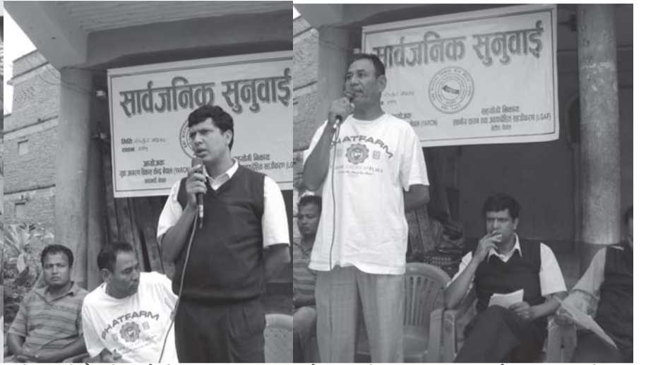
युवा जागरण विकास केन्द्रको आयोजनामा र सहयोगी संस्था स्थानीय शासन तथा जवाफदेहीता सहजीकरण हेटौडाले सार्वजनिक सुनुवाई तथा कार्यान्वयन प्रतिवद्धता सुनुवाई कार्यक्रममा सहभागीहरू

यस वर्ष अर्थात् ०६८/०६९ आ.व.म महिला वालवालिका तथा जेष्ठ नागरिकको लागि धीअ लाअव रुपैयाँ बजेट छुट्याईएको छ । जुन अहिलेसम्म माइन्टमा लेखेको छैन ।